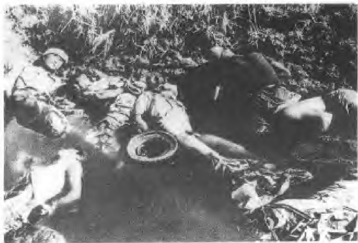
▲血池——在南京城郊，中国人民被日军反绑双手枪杀后，抛入池中，尸体达三百余具。