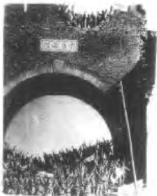
▲1937年12月13日，日军攻破南京中华西门，一场大屠杀从此开始。