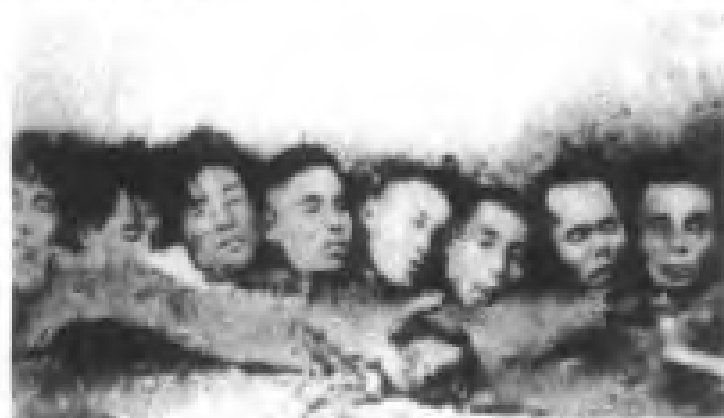
▼ 日军将我同胞头颅砍下炫耀其战绩。