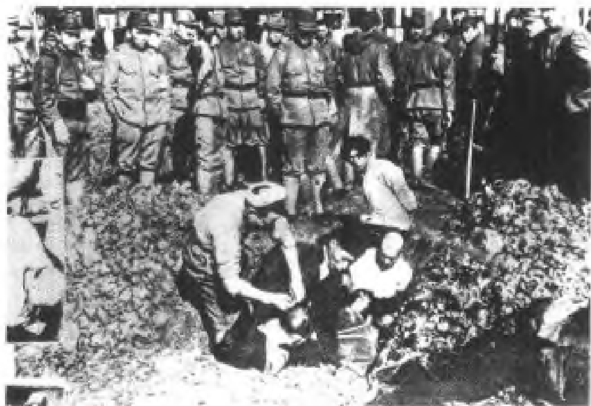
▲ 1937年12月侵占南京的日寇，活埋我同胞之惨状。