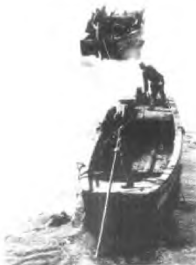
▲ 将屠杀后的中国人尸体拖到江中去灭迹。

▼ 日军在进攻南京途中，即展开大屠杀。向井敏明和野田毅两名灭绝人性的日军军官进行的“杀人竞赛”更成为在日本国内外广泛传播的兽行铁证。