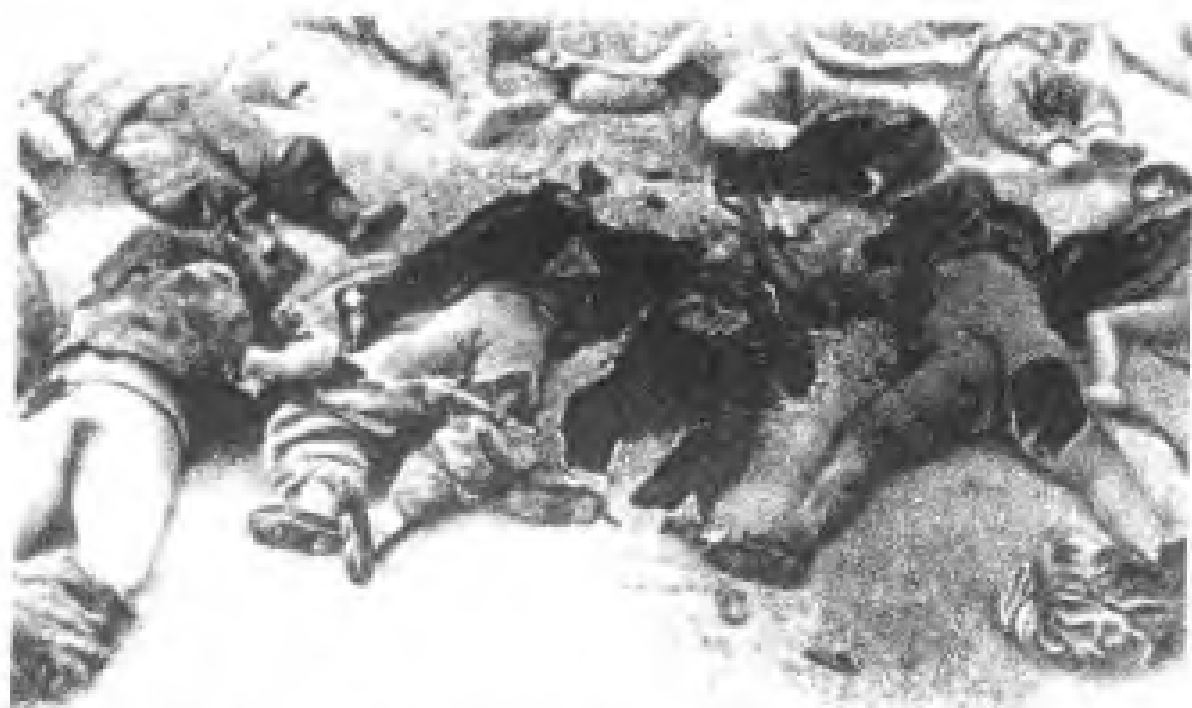
▲ 估计约有两万至八万名南京妇女惨遭日军强奸并屠杀。