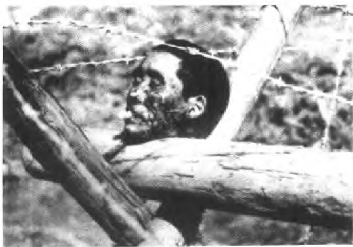
▲ 1937年12月 日军攻陷南京，大肆屠杀我军民。这是日军在南京城外铁丝网上放着一个中国抗日战士人头。